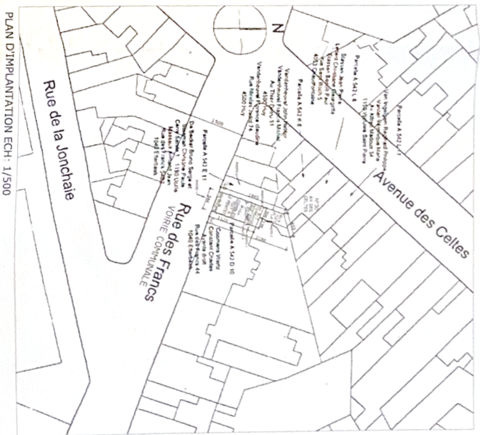
PLAN D'IMPLANTATION ECH: 1/500